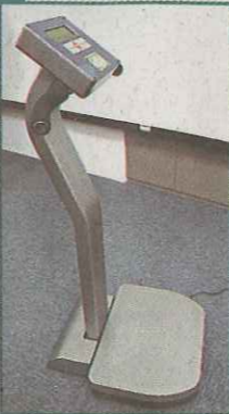
中大研發的振動治療平台，預計明年中推出市場。