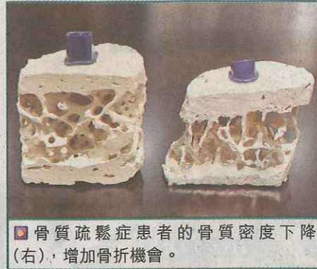
骨質疏鬆症患者的骨質密度下降(右)，增加骨折機會。